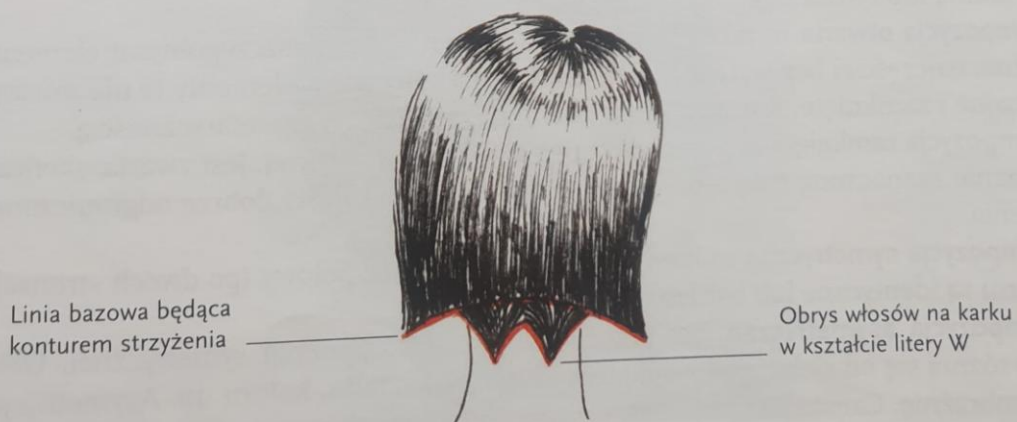
Rys. 10.9. Kontur zewnętrzny – obrys włosów na karku