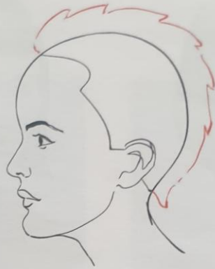
Rys. 10.7. Kontur zewnętrzny – ujęcie z profilu

Kontur zewnętrzny wpływa również na wielkość twarzy – fryzury o dużej objętości zmniejszają optycznie twarz, a o małej objętości – powiększają.