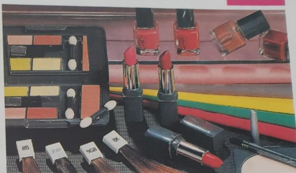
Rys. 2.76. Kompozycja kolorów w kosmetyce